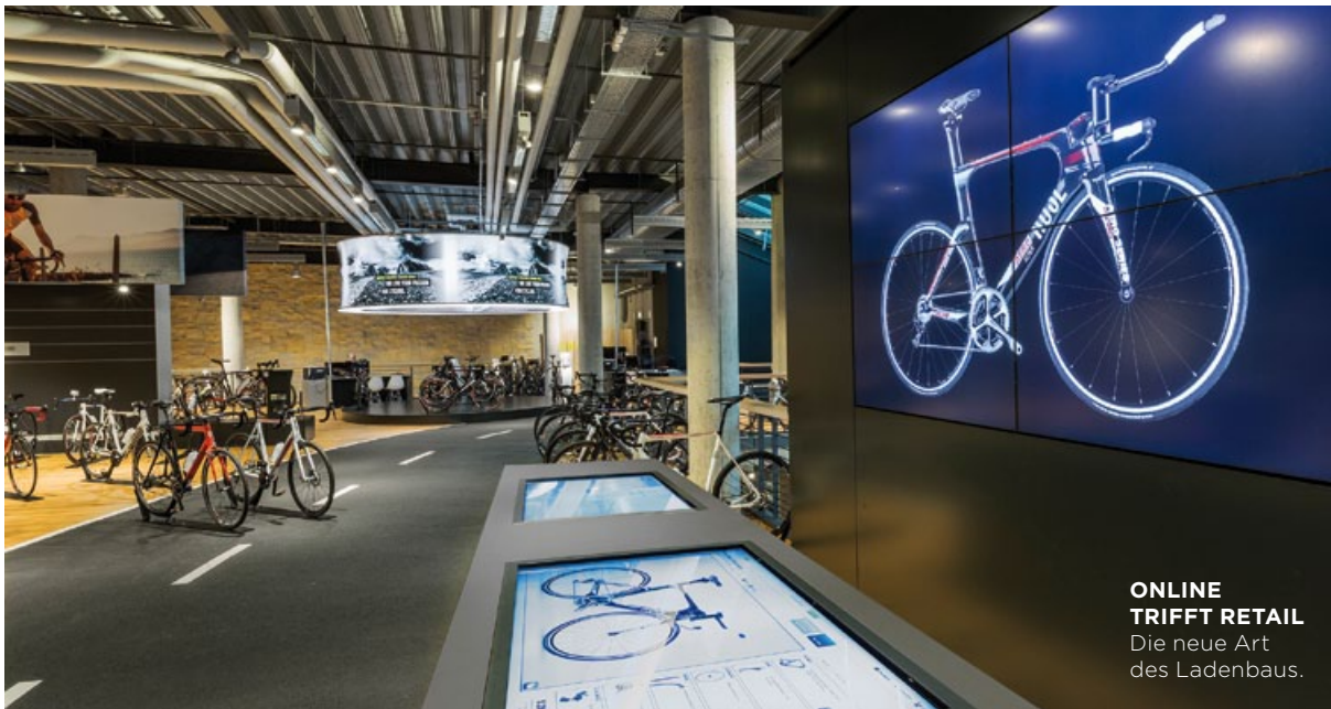
ONLINE TRIFFT RETAIL Die neue Art des Ladenbaus.

lichkeit ist die Bewerbung von Komplementär-Produkten, wie z.B. Bier an der Grillfleischtheke. In Kombination mit weiteren Komponenten wie Beacons oder Kundenkarten ermöglichen Digital-Signage-Systeme sogar eine individualisierte Kundenansprache.