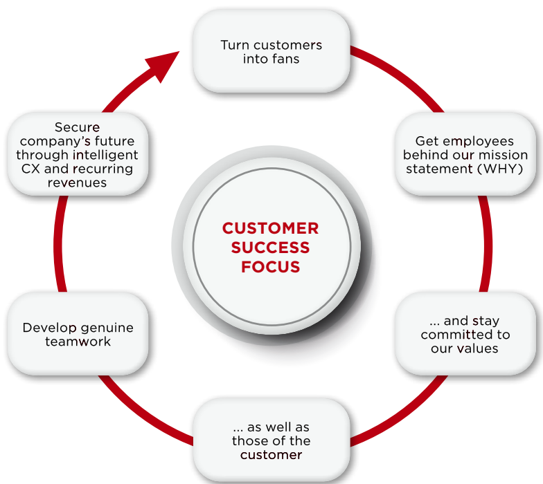
Abb. 4: Change-Management als Basis für eine erfolgreiche Einführung des Customer-Success-Management

Zur Etablierung des Kundenfokus' innerhalb eines Unternehmens ist die klare Definition einer Vision seitens des Managements notwendig. Die Vision sollte dabei eindeutig kommuniziert werden, sodass alle Mitarbeiter verstehen, warum die Änderungen stattfinden und welche Vorteile sie bringen. Von entscheidender Bedeutung ist das starke Engagement der Führungsebene, um die Veränderungen voranzutreiben. Zur erfolgreichen Etablierung der CSM-Strategie wird ein langfristiges und nachhaltiges Change-Management benötigt. Nur, wenn die Mitarbeiter den Kulturwandel mittragen,