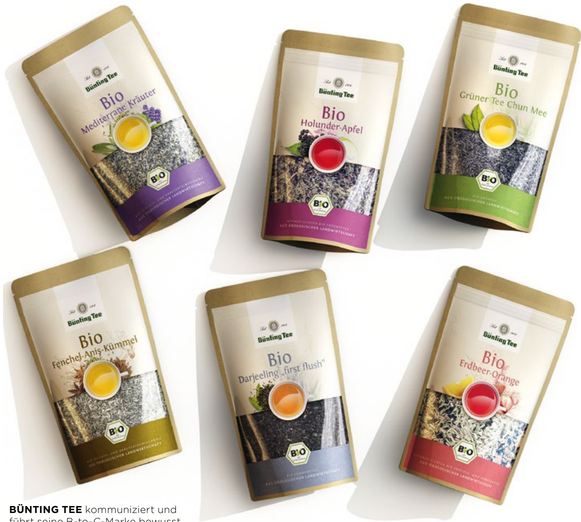
BÜNTING TEE kommuniziert und führt seine B-to-C-Marke bewusst – auch über Verpackungsdesign.

Produkte und Serviceangebote, die sie durch kontinuierliche Verbesserung bestehender Nutzenangebote stetig weiterentwickeln.